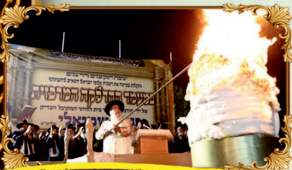
שוחפות בשמן כהדלקת מו"ד - 260 ש"ב

ע"י מו"ד הגאון המקובל רבינו בניהו שמואל'י שליט"א