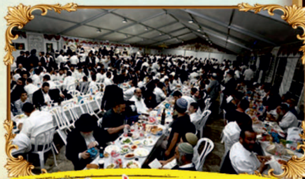
מניין סוקדים בסיום חגודת העולמי - 540 ש"ב