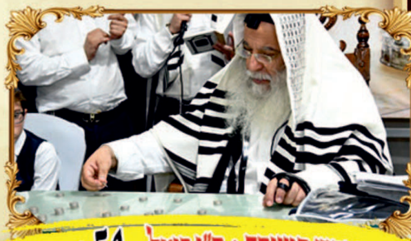
בדיקון נפש המיוחד + ח"י דומל - 54 ש"ב