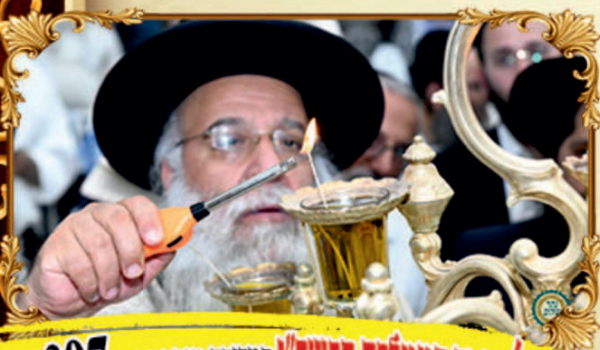
הדלקת נר במטלפת הרשב"י במסגרת מוקדמות - 807 ש"ב